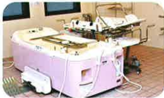
寝たまま入浴 できる最新型特浴