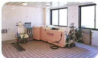
車イスのまま入浴 できる特浴