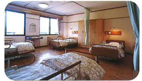
4人部屋 17部屋 (22畳程度)