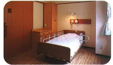
個室 16部屋 (11畳程度)