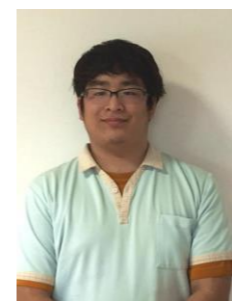
夜間宿直、介護補助