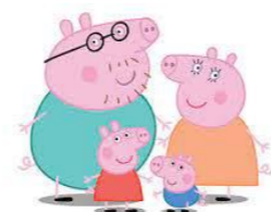
生活相談員 船引 健司

好きなテレビ番組 子供と一緒に観る幼児向けアニメ「パウパトロール」と「ペッパピッグ」にはまっています(笑)♡